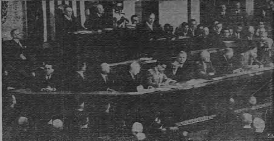
Momento solemne en que el general Mac Arthur pronuncia su histórico discurso ante el Congreso de los Estados Unidos

bancos eran deudores del Central, por un concepto de rescudaciones, por un total de $4,881,000.00 suma que se descompone así: