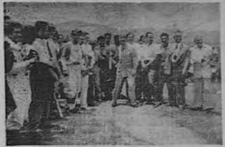
Momentos en que el señor Presidente de la República, don Chilio Ulate, lanza el clásico strike, dando por iniciado el campeonato nacional de baloibol de primeros divisiones. El jefe del Estado juramentó a todos los atletas que tomarán parte en los diversos campeonatos de pelota chica.