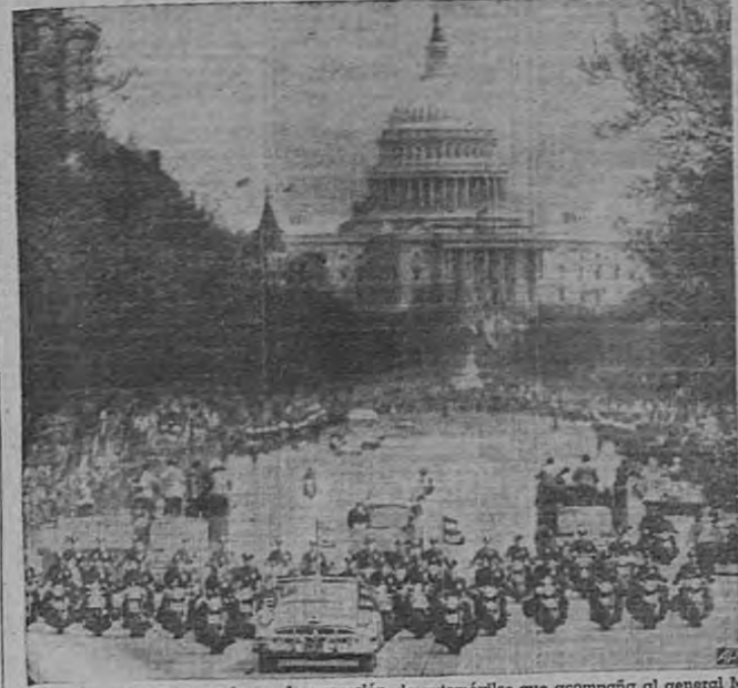
Policia de motocicleta encabeza la procesion de automóviles que acompaña al general Mac Arthur por la Avenida de Pensilvania al dirigirse desde el Capitolio (al fondo) hasta el jardín que rodea el monumento de Washington, para una inmensa fiesta cívica. El automóvil del General está inmediatamente detrás del escuadrón de motocicletas.

En algunos puntos los atacantes han llegado hasta el prelo Paralelo 38, pero a costa de grandes pérdidas ante la tenaz resistencia del 8º Ejército