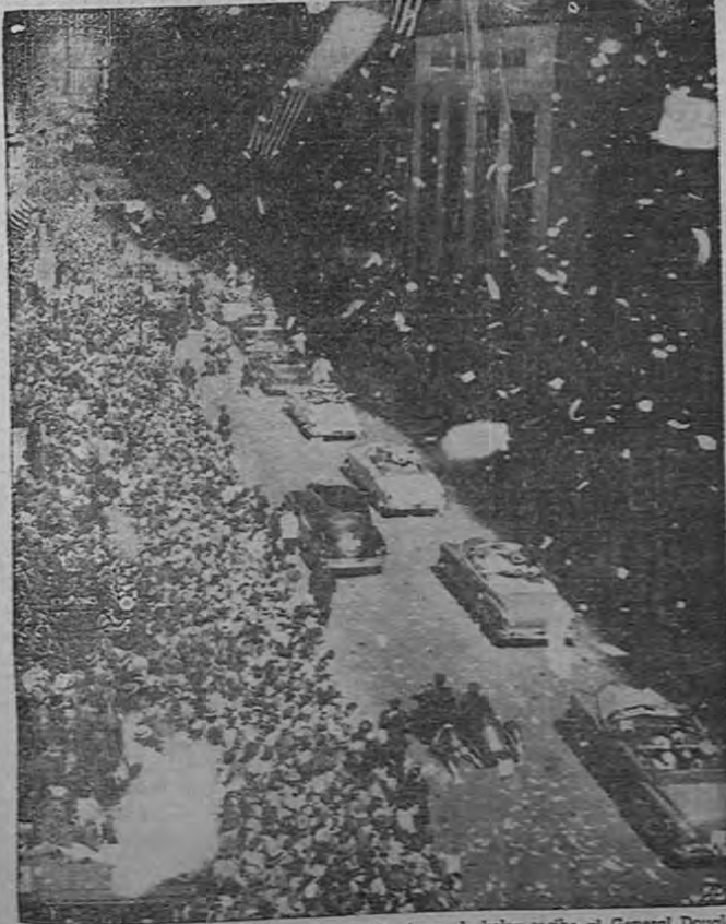
La lluvia tradicional de cintas de papel con cotizaciones de bolsa recibe al General Douglas Mac Arthur cuando la procesion de automóviles que lo acompaña avanza por Broadway desde Bowling Green hasta el Municipio, en la fiesta que le hizo Nueva York al gran general, el 23 de abril.